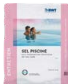
Le sel spécial piscine est conforme à la Norme EN 16-401