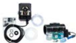
Kit pH pour Electrolyseur PRO