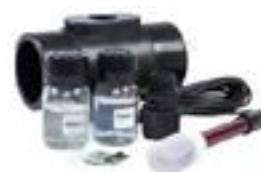
Kit Rédox pour Electrolyseur PRO